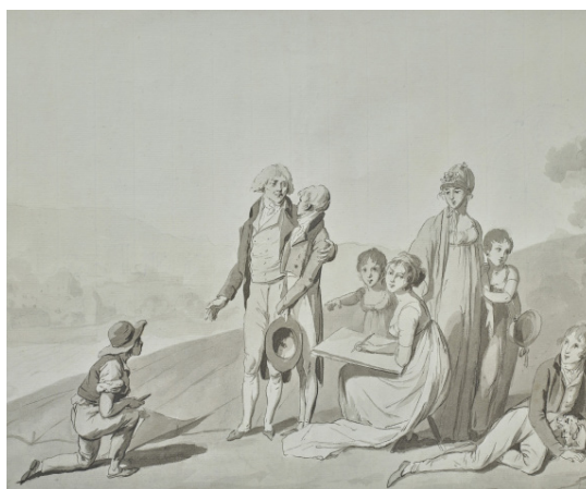
Oberkampf et sa famille , vers 1803, dessin de Louis-Léopold Boilly, plume et encres brune et grise, lavis gris sur papier

Pour soutenir ce projet d'acquisition, rendez-vous en ligne : www.dartagnans.fr