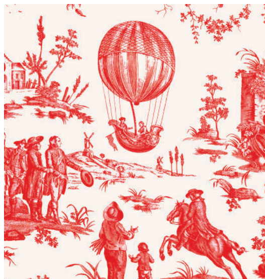
Inv.002.0.37.i Ballon de Gonesse -création : Manufacture Oberkampf (Manufacture) vers 1784, Jouy-en-Josas

Le Musée de la Toile de Jouy est une institution muséale fondée en 1977, Musée de France, situé à Jouy-en-Josas au cœur des