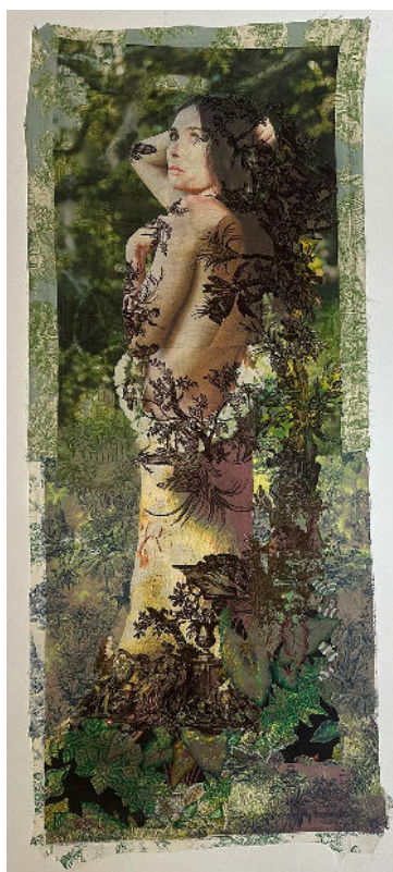
Demi Moore (actrice) en arbre (d'après Cranach l'ancien) sur un assemblage de toiles marron, verte et bleue).2017. Impression unique à jet d'encre sur tissu imprimé, fil. Collection de Tim Hailand

Elle retrace plus de dix ans de recherches artistiques.